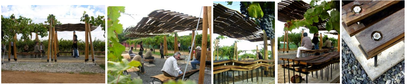
2003 CASA CUDICO_ IX Región de la Araucanía, Licanray, Chile.