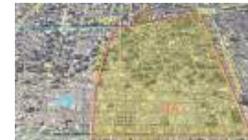
Mejoramiento Alumbrado S4A