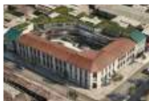
CESFAM Matta Sur