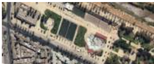
Mejoramiento Parque Los Reyes