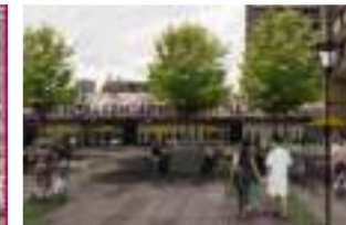
Plaza El Pedregal