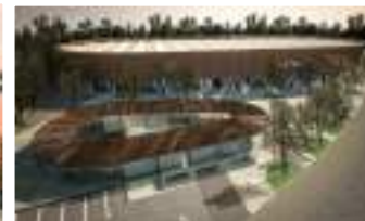
Patinódromo P. O'Higgins