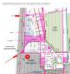
Nodo Antofagasta – Mirador - B. Guerrero