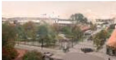
Hermanitas de los Pobres