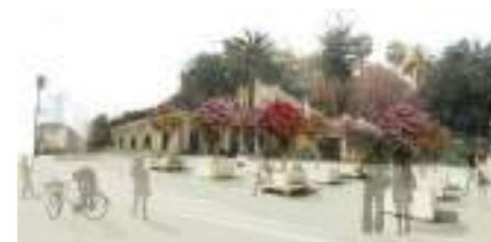
Explanada Santa Lucia