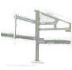
Mejoramiento B. Meiggs