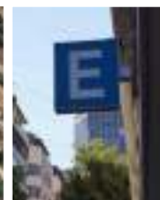
Est. Subt. T. Jiménez