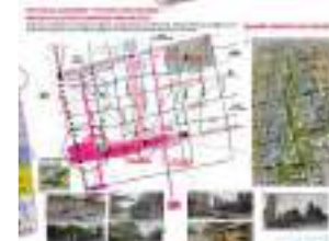
Remodelación Parque Almagro