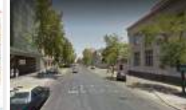
Mejoramiento Av. España