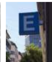
Est. Subt. G. Mackenna