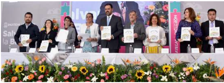
El gobernador Tello (centro) y otras personalidades clave en la presentación de la guía española en Zacatecas